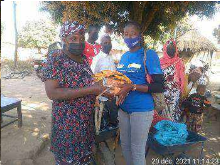
Kérouané : remise des outillages du groupement Nafaya, au domicile de la présidente.