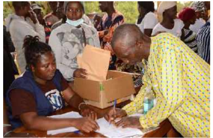
Photo de la signature d'un chef de ménage après avoir reçu son enveloppe de cash transfert.