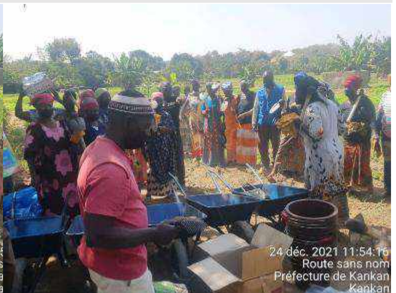
Kankan : remise des outillages du groupement Kièdèmin de bordo, sur leur périmètre maraicher.