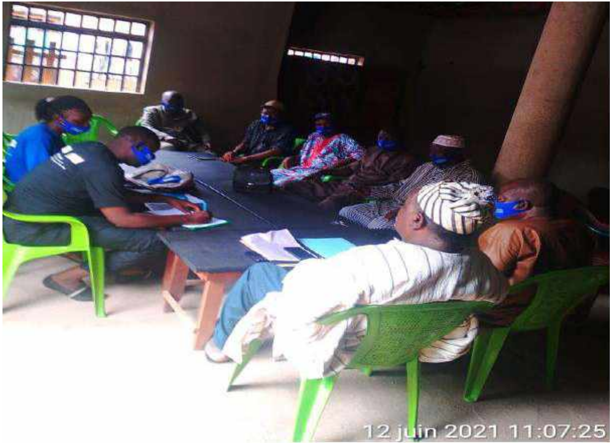
12 juin 2021 11:07:25