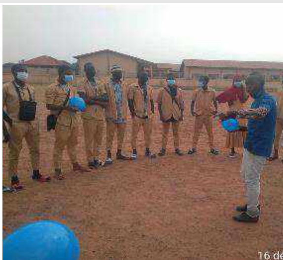
Kouroussa : séance de sensibilisation des jeunes sportifs sur la pandémie à COVID-19

3 déc. 2021 18:07:04 Préfecture de Kouroussa Kankan