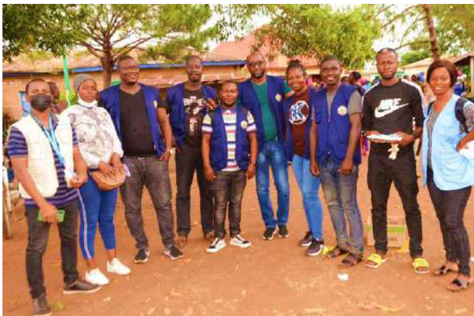
Supervision de l'opération de distribution du cash : De la gauche vers la droite, les Représentants de la Direction nationale de l'Action Sociale, de l'UNICEF, de la Direction préfectorale de l'Action sociale et le superviseur de ENFANTS DU GLOBE suivant de près le déroulement de la distribution du cash à Gouécké.