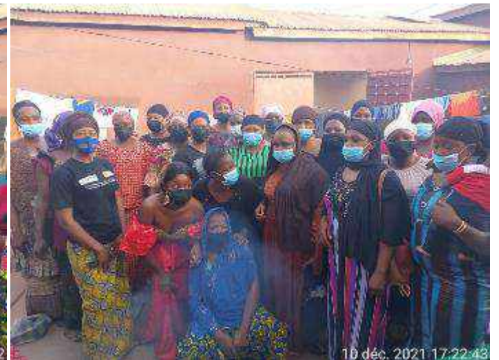
Mandiana : séance de sensibilisation d'un groupement féminin sur la pandémie à COVID 19.