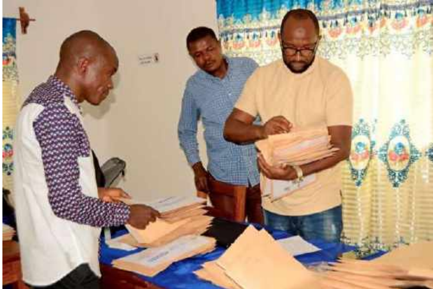
Opération de conditionnement du cah au bureau de EDG