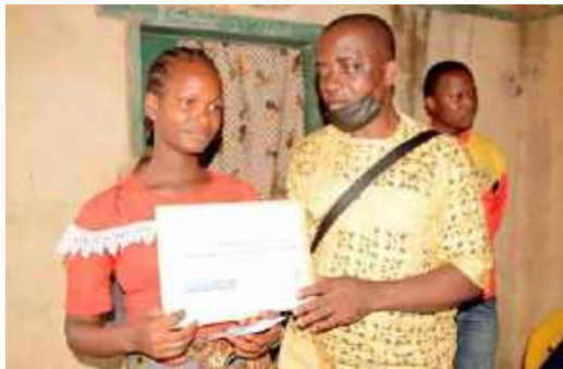
A gauche : Le représentant du ministère de l'action sociale remettant le cash. A droite : le Sous-préfet et le maire de la CR de soulouta avec la mission de distribution du cash