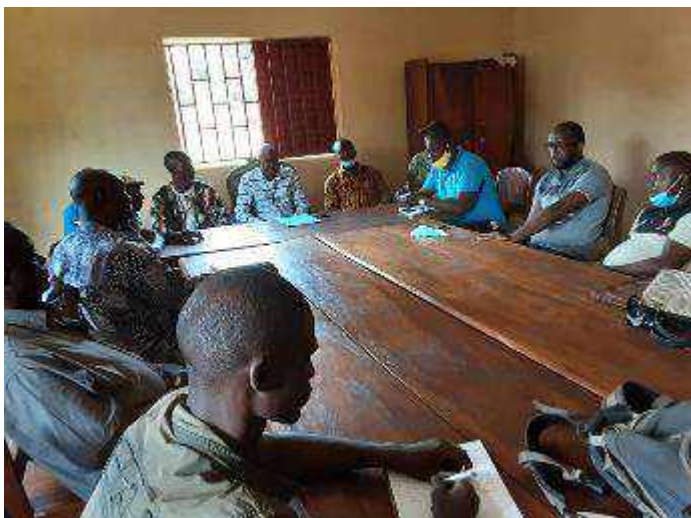
Prise de contact avec la mairie de Gouékké en présence des conseillers communaux