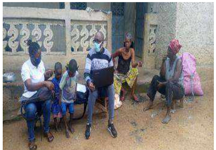
Le Gestionnaire de la base de données sur le terrain pour la vérification physique des membres des ménages identifiés à Gouékké.