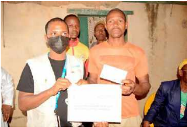
A Kpagalaye : Photo du Représentant de l'UNICEF qui venait de remettre le montant du cash transfert à un chef de ménage détenant son enveloppe et le ticket de remise