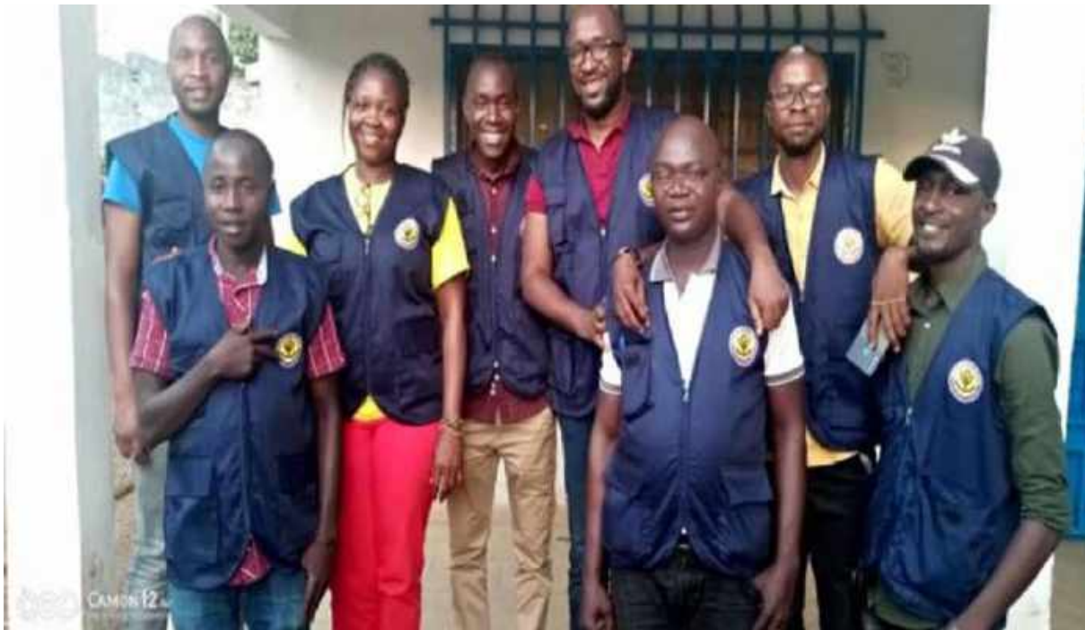
Photo de l'équipe d'identification juste après leur orientation sur le questionnaire

Cette journée d'orientation s'est achevée par des séances de simulation pratique de remplissage du questionnaire entre agents suivies de la remise des imprimés du questionnaires aux travailleurs sociaux en fonction du nombre de personnes à identifier par zone.