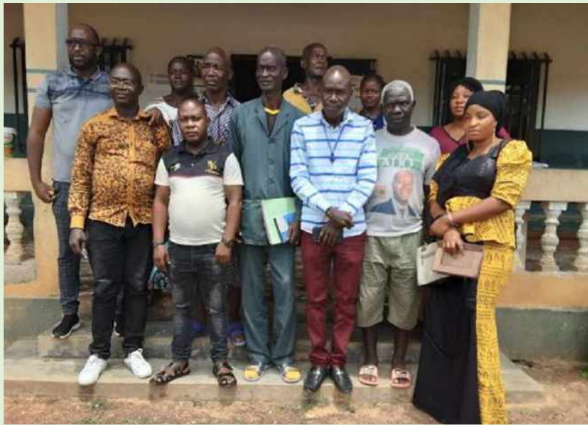
Photo du Coordinateur, du superviseur et du Gestionnaire de la base de données avec le président de district lors du passage de la mission à Kpagalaye