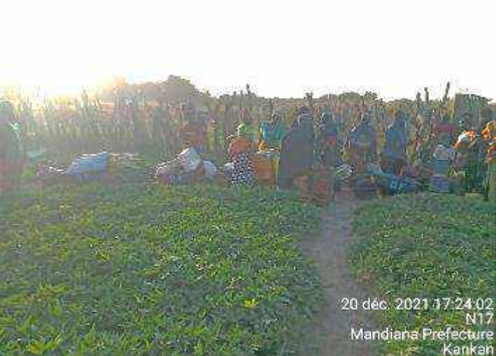
Mandiana : remise des outillages du groupement Bènkady, sur leur périmètre maraîcher.