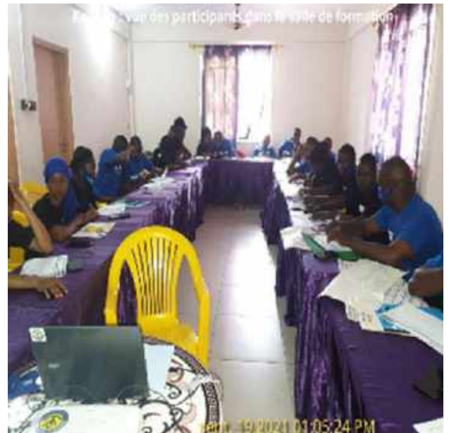
Vue des participants dans la salle de formation, à gauche préfecture de Sigui et à droite préfecture de Kankan