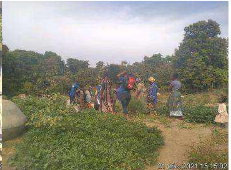
Sigiri : remise des outillages du groupement Sabougnouma, sur leur périmètre maraicher.