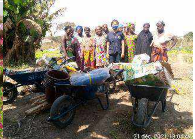
Kouroussa : remise des outillages du groupement Sabougnouma de Wassakö, sur leur périmètre maraicher.