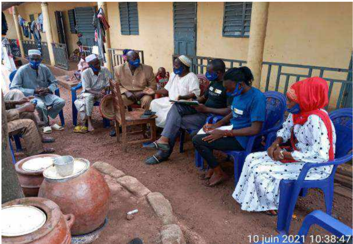
10 juin 2021 10:38:47