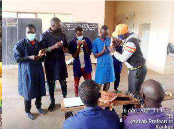
Kankan : de la gauche vers la droite : animation de l'activité « plus légère que l'air » qui vise à promouvoir l'inclusion dans une vie communautaire et « où est ma banane » qui vise à comprendre et respecter la diversité.